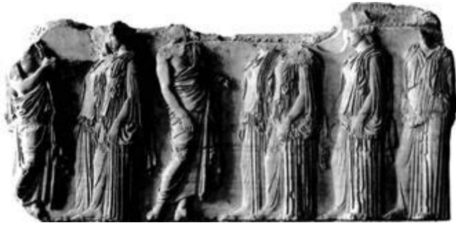
Фрагмент фриза Парфенона.